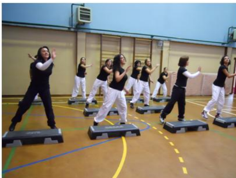
Directo no âmbito da música e movimento