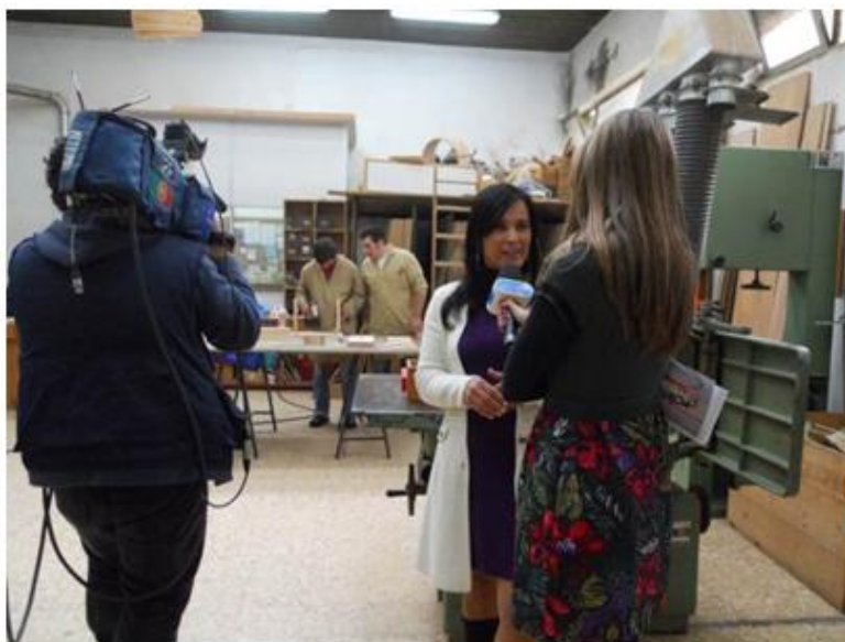
Directo no âmbito do Centro de Formação e Emprego da CERCIFAF

Estar em contacto com pessoas que apenas se conhecem da televisão foi maravilhoso. Ver como se faz televisão foi um acontecimento que muitos jamais irão esquecer.