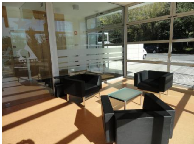
Instalações do novo Centro de Actividades Ocupacionais Fornelos - Fafe