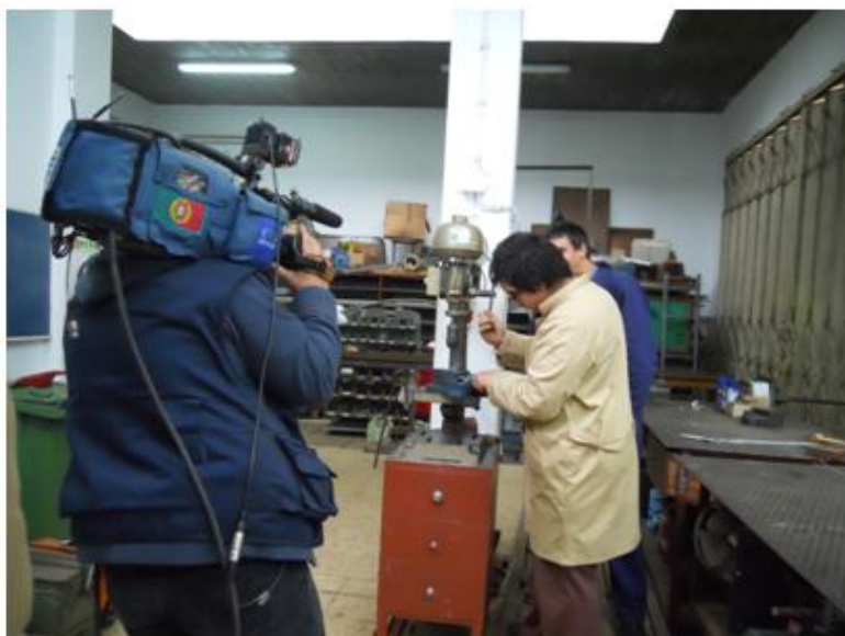
Directo no âmbito do Centro de Formação e Emprego da CERCIFAF