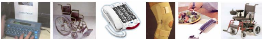
Alguns exemplos de Ajudas Técnicas

Na sequência de uma candidatura apresentada ao Instituto do Emprego e Formação Profissional, a CERCIFAF foi reconhecida e autorizada a ser um Centro Financiador de Ajudas Técnicas, por despacho da Comissão Executiva datado de Janeiro de 2004.